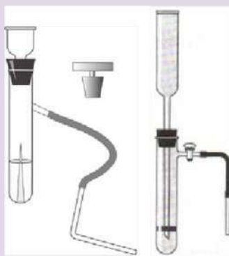
Рис. 7. Прибор для получения и собирания газов

Прибор для получения газов используется для получения небольших количеств газов: водорода, кислорода (из пероксида водорода), углекислого газа.