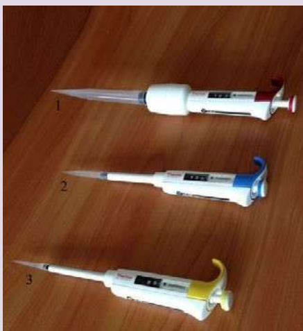
Рис. 5. Пипетки дозаторы одноканальные переменного объёма: 1 — 110 мл; 2 — 100—1000 мкл; 3 — 10—100 мкл.

Пипетка-дозатор — приспособление, используемое в лаборатории для отмеривания определённого объёма жидкости. Пипетки выпускаются переменного и постоянного объёма. В комплекты оборудования для медицинских классов входят удобные пипетки-дозаторы одноканальные, позволяющие настроить необходимый объём отбираемой жидкости в трёх различных диапазонах (рис. 6). Использование современных технологий и цветовой кодировки диапазона дозирования даёт возможность качественно, точно, безопасно выполнять пипетирование. Пипетки имеют сменные пластиковые наконечники.