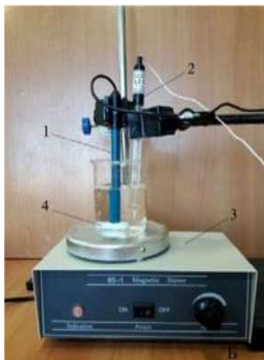
Рис. 2. Установка для определения концентрации (активности) хлорид-ионов в растворе. А: 1 — корпус датчика для определения \text{Cl}^- -ионов; 2 — разъём Micro USB для подключения к компьютеру; 3 — разъём BNC для подключения рабочего электрода; 4 — разъём для подключения электрода сравнения. Б: 1 — ионоселективный электрод (рабочий электрод); 2 — электрод сравнения (хлорсеребряный электрод); 3 — магнитная мешалка; 4 — якорь магнитной мешалки

Запрещается трогать мембрану электрода пальцами и приводить её в соприкосновение с твёрдыми поверхностями. При хранении ИСЭ чувствительная часть датчика (мембрана) должна быть защищена специальным колпачком. Не допускается использовать электроды с полимерной мембраной в средах, содержащих летучие вещества или органические растворители. Не следует использовать ИСЭ в сильных окислителях. Длитель-